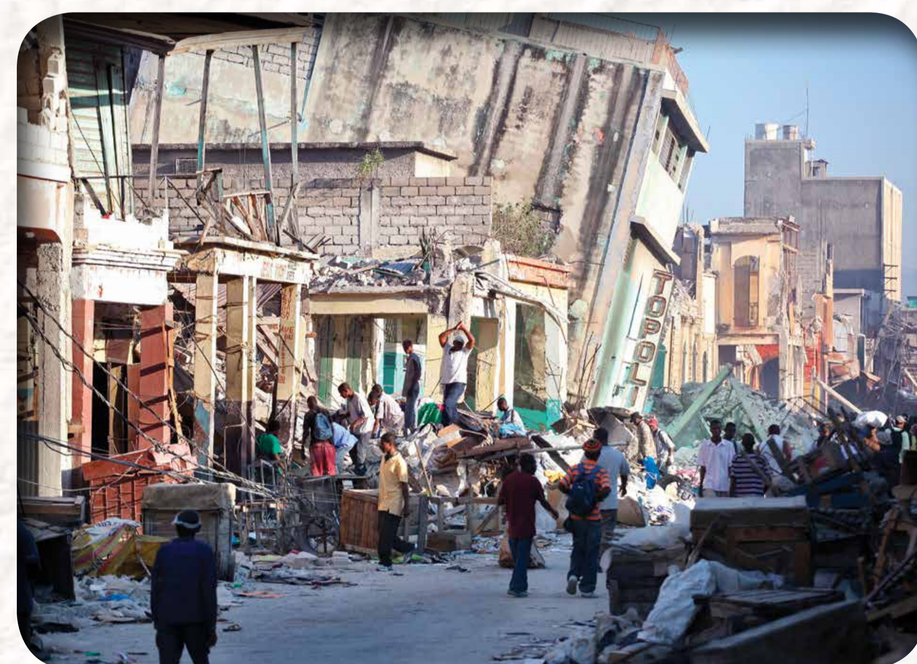
Port-au-Prince (Haïti) au lendemain du séisme du 12 janvier 2010

Après un séisme, qui peut durer 1 à 2 min, coupez si possible le gaz, l'eau et l'électricité et évacuez les lieux.