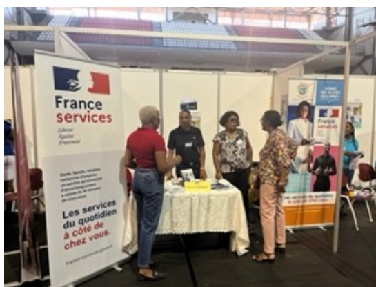
Stand tenu par le réseau départemental des espaces France Services

présentant les dispositifs de droit commun (politiques sectorielles qui s'appliquent sur l'ensemble d'un territoire sans distinction entre les quartiers). Le vendredi était consacré à des conférences abordant les enjeux stratégiques de Guadeloupe en matière de solidarité, également animées par le dispositif média jeunes. Pendant les deux jours, un mur des annonces permettait aux visiteurs de partager les besoins (ex : bénévolat, locaux, offres d'emploi...) et les services (ex : co-voiturage, création de sites web...).