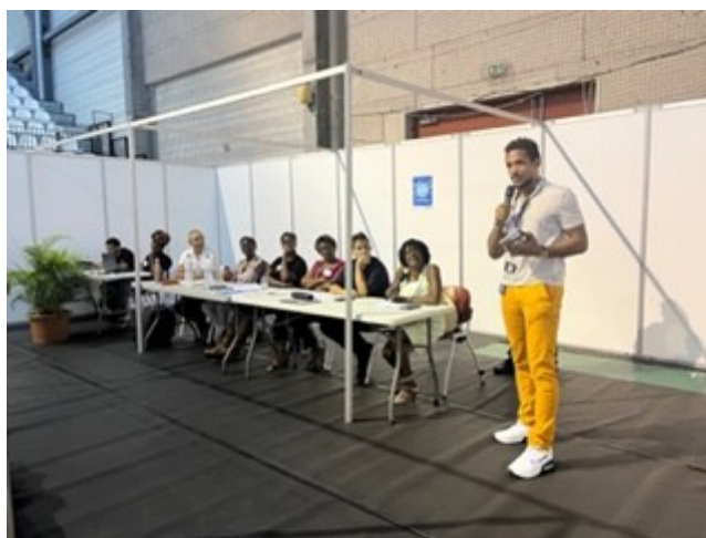
Table-ronde “Le fonctionnement en réseau et les partenariats : quels modèles pour faciliter la gouvernance et l'accès aux financements ?” en présence de la FEVES, de la CGSS, de la Chambre Régionale de l'Economie Sociale et Solidaire de Guadeloupe, animée par le dispositif média jeunes.

Ces échanges ont permis de faire ressortir deux grands défis à relever pour renforcer et pérenniser l'accompagnement des publics en situation de précarité vers l'autonomie.