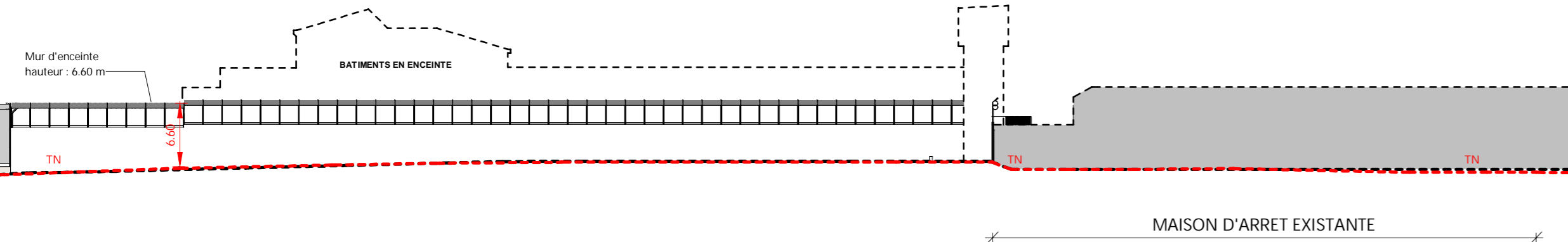
BB Coupe 2 1 : 500