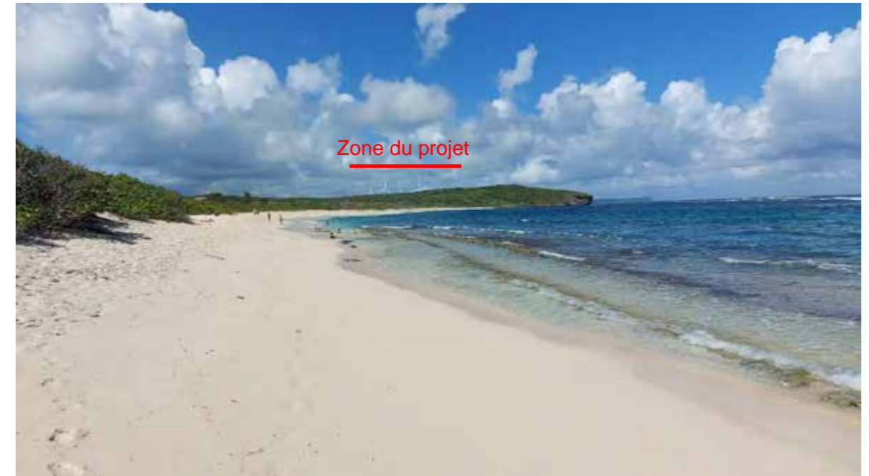
PC8 – e : Vue depuis l'Anse à la Gourde