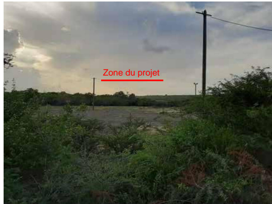
PC8 – d : Vue depuis le Chemin des éclaireurs

Hormis pour ce qui concerne le propriétaire des terrains, les habitations les plus proches sont à plus de 1 km, d'où on ne perçoit que les pentes végétalisées des bordures de la partie mornée du terrain.