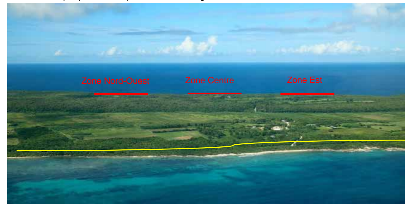
PC8 - c : Vue aérienne de la frange arborée qui empêche les vues depuis la route (surligné jaune)