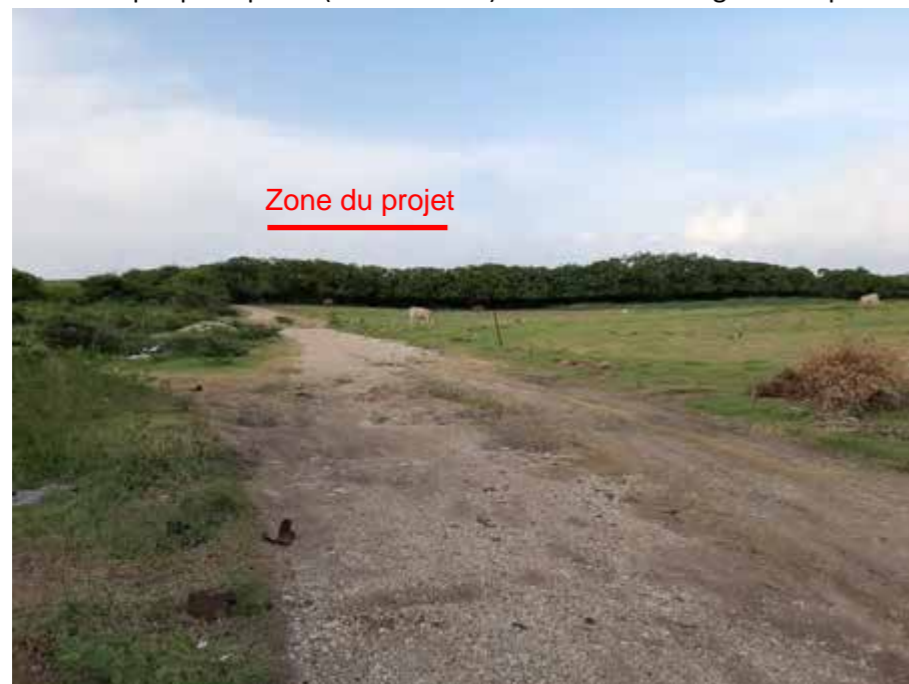
PC8 - b : Vue depuis la RD 118 (au niveau de l'anse Kahouanne)

Le site n'est pas perceptible (zone mornée) en raison de la végétation qui borde la route et empêche toute vue vers le Nord, seules quelques chemins permettent de distinguer la zone mornée.