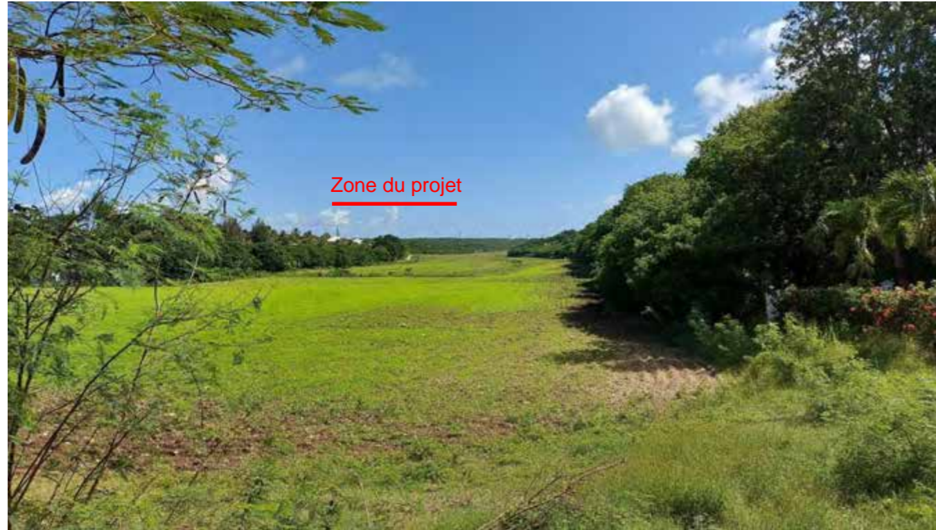
PC8 – a : Vue depuis l'avenue Yolaine Filleau Belloni, en arrière-plan du Vallon d'Or

Le site n'est perceptible (zone mornée) que depuis les trouées visuelles dans la végétation, avec un appel visuel lié au parc éolien