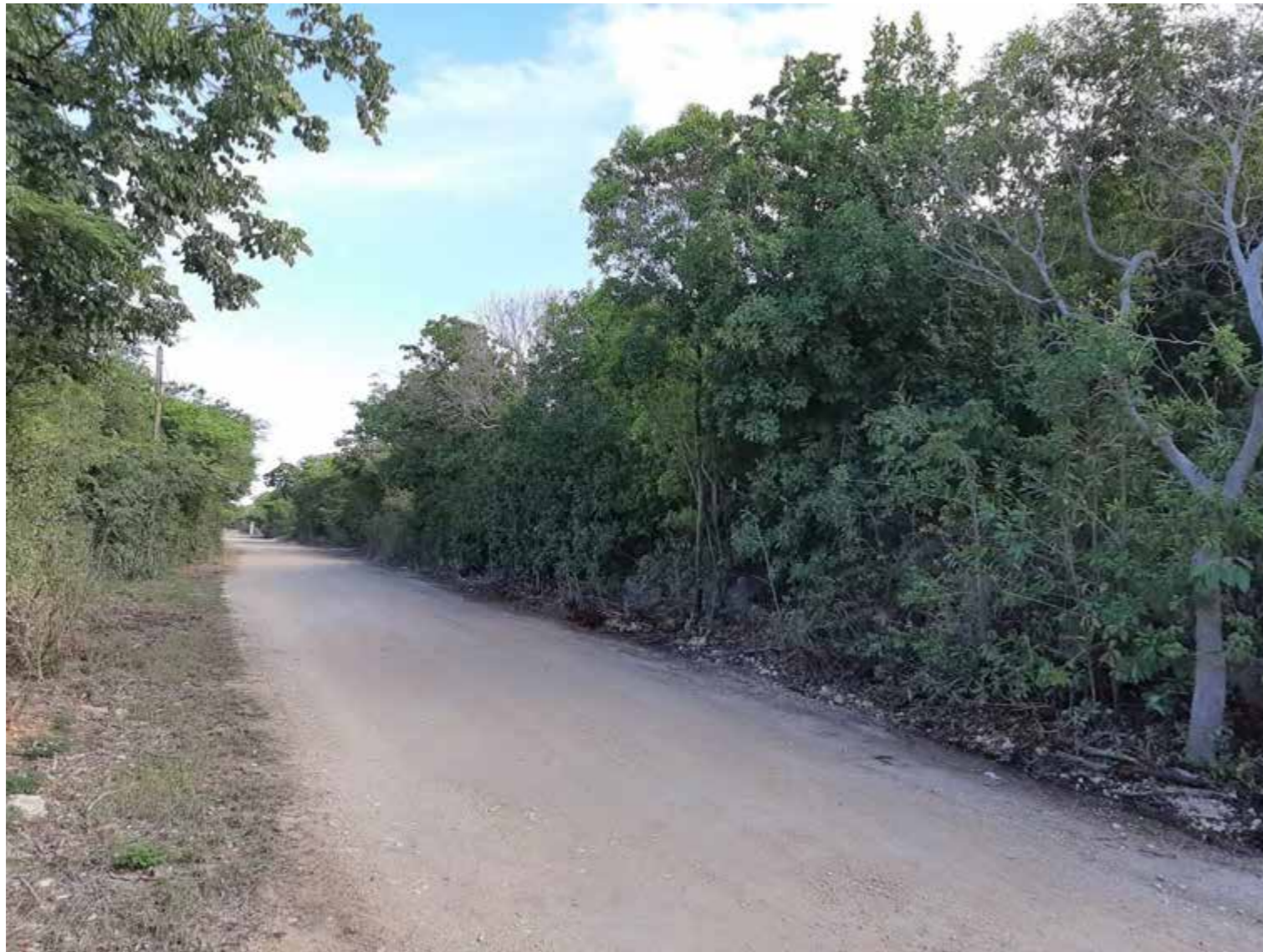
PC7-a : Partie Ouest du site, le long du chemin de Fond Caraïbe