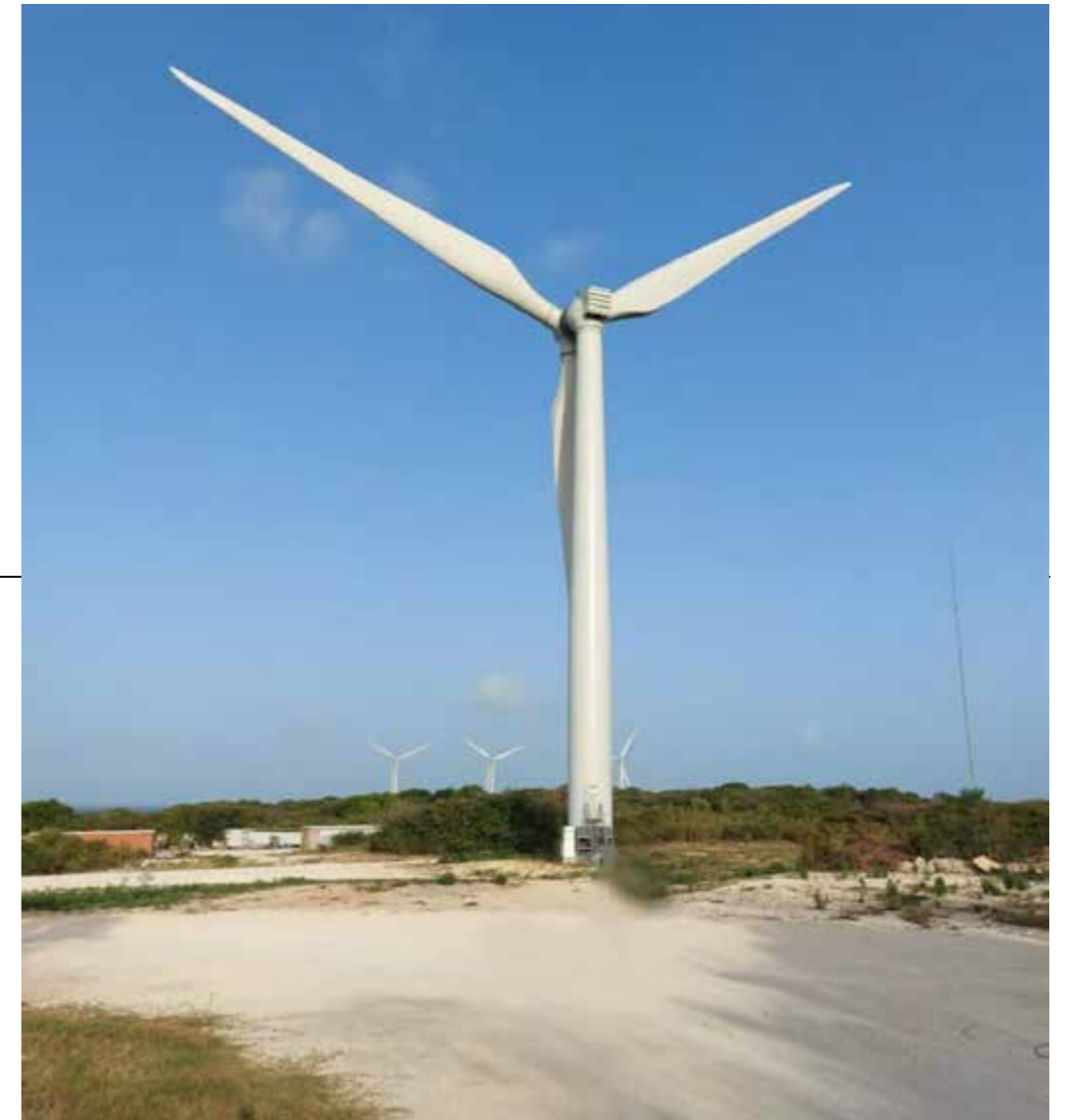
PC7-b : Partie centrale du site, équipements du parc éolien