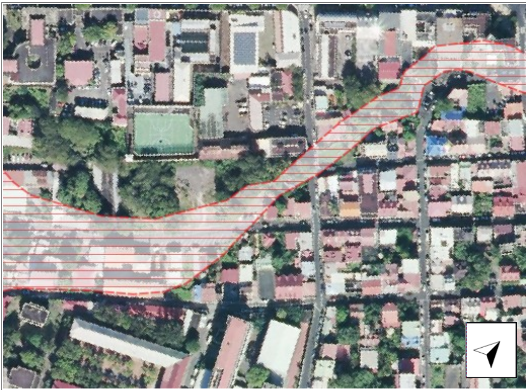
Zonage avant modification (secteur du Carmel)