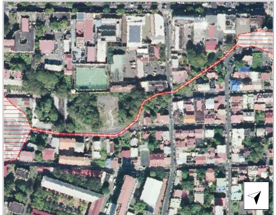
Zonage après modification (secteur du Carmel)