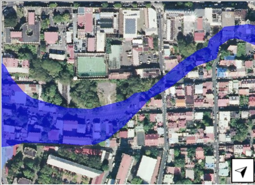
Aléa inondation fort avant modification (secteur du Carmel)